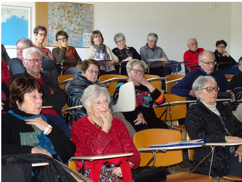
Lundi 3 février : réunion du secteur de Sisteron/Château-Arnoux dans les locaux de l'aérodrome de St Auban. Forte participation.

Fin janvier/début février 2020, quatre réunions de secteur se sont tenues. La réunion du secteur de Barcelonnette, prévue le 25 mars, n'a pu avoir lieu en raison du confinement.