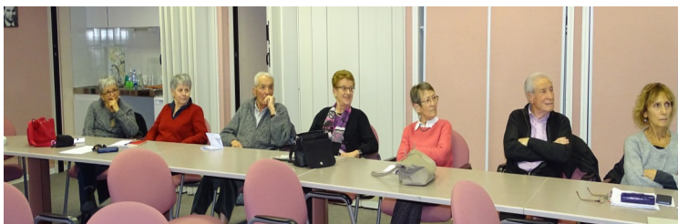
Lundi 27 janvier : réunion du secteur de Digne/St André dans les locaux de la MGEN. Une douzaine de participants.