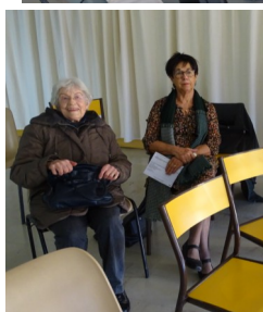
Mardi 4 février : réunion du secteur de Manosque à la MJC de Manosque