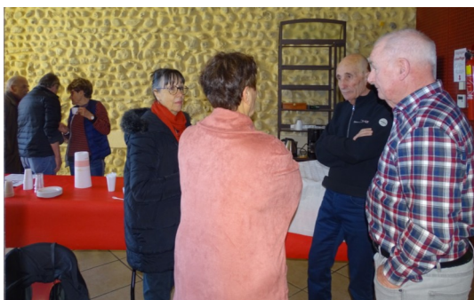
Vendredi 7 février : réunion dans une salle de la mairie de Valensole (11 participants)